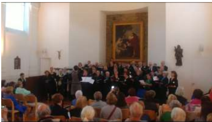
Internationales Chorkonzert unter Gabriella Costa ↓