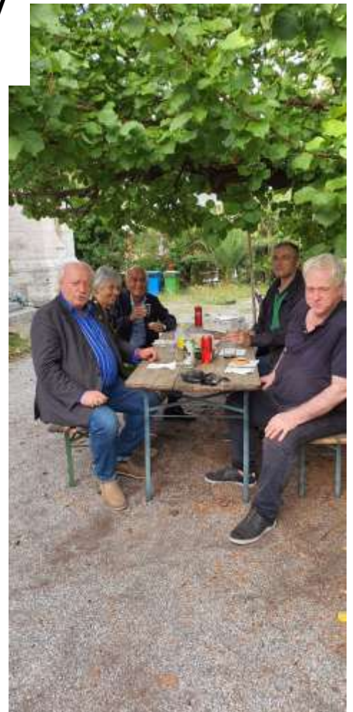
↑ In attesa del Culto