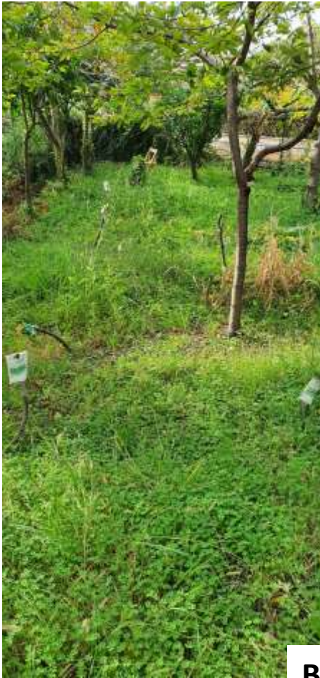
↓ Orto urbano in itinere