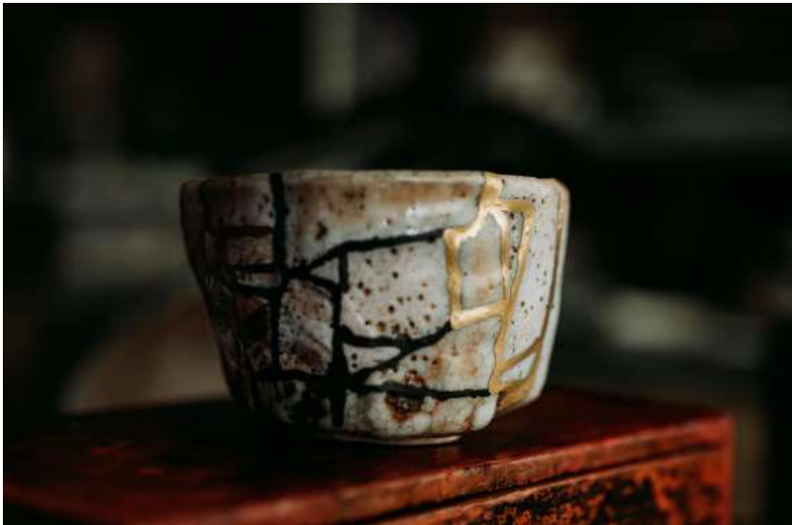
Vaso Kintsugi

“Io sono la via, la verità e la vita.” ( Giovanni 14,6 )