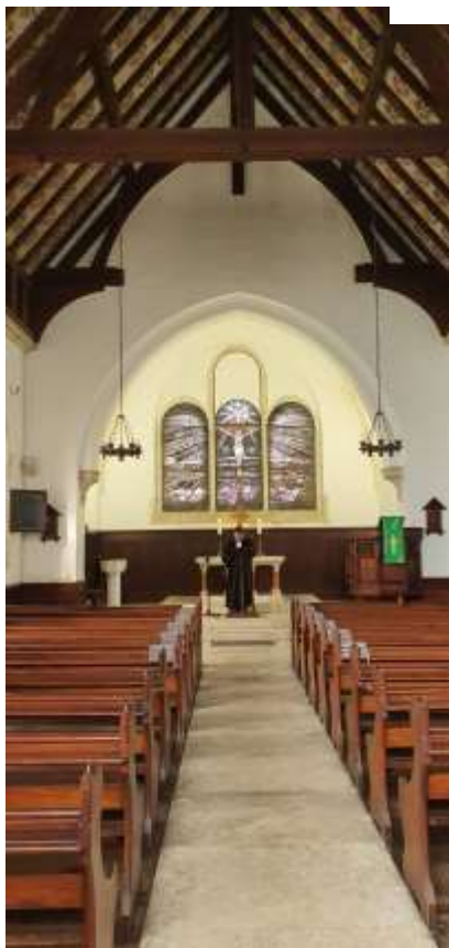
↑ Suggestione in solitario