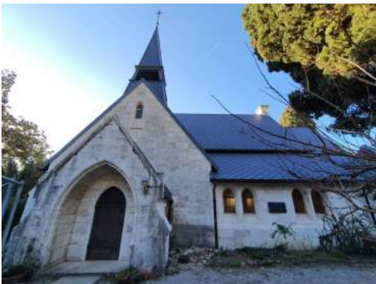
← Il nuovo tetto